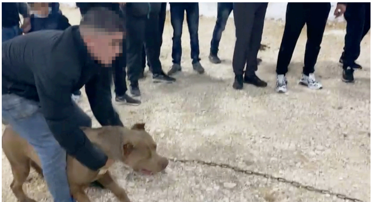
*צילום מתוך סרטון וידאו שנמסר לי ע"י אחד המשתתפים במחקר, בו נראה תחילתו של קרב.

בסביבת המעורבים בקרבנות אין מקום להפגנת חולשה או כאב. דינו של הכלב החלש יותר הוא אחד - מוות; או בקרב או לאחר הקרב. ד': "היה לי כלב, היה פצוע מהקרב. היה לו תפר פה ביד (מצביע על המרפק), היה לו חור