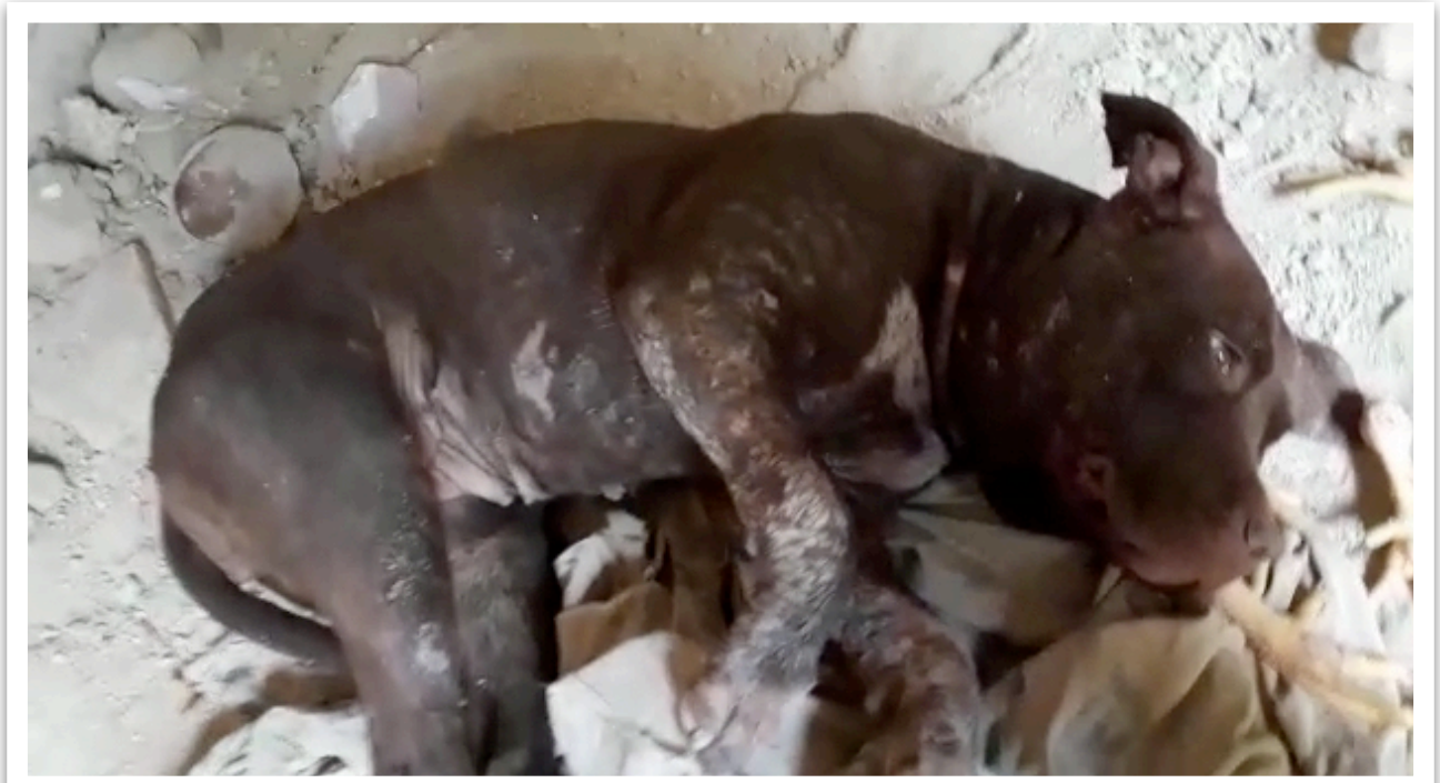
*צילום מתוך סרטון וידאו שנמסר לי ע"י אחד המשתתפים במחקר, בו נראית כלבת פיטבול לאחר שהפסידה בקרב.

ההתקשרות כולה עם שלושה מהמשתתפים התבצעה באמצעות המשתתף הרביעי, אשר לו היכרות משותפת עם השאר, שמצידו ניהל את כל התיאום עמם כגורם מקשר. המפגשים התקיימו בתחנות דלק על אם הדרך. כל מפגש התקיים בתחנת דלק אחרת וארך במוצע כשעה.