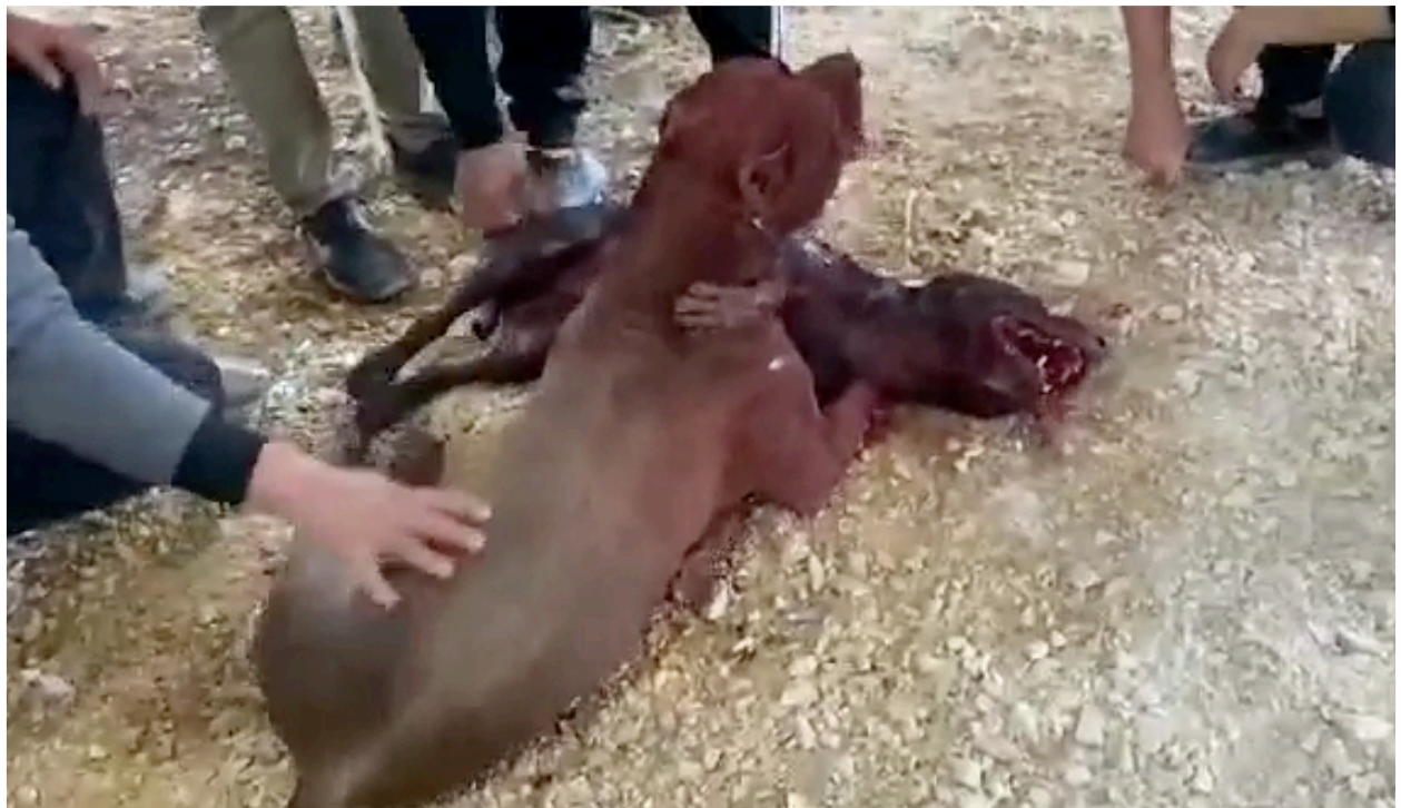
*צילום מתוך סרטון וידאו שנמסר לי ע"י אחד המשתתפים במחקר, בו נראים שני כלבי פיטבול לקראת סוף הקרב.

בישראל אין כלל סטטיסטיקות המציגות את תופעת קרבות הכלבים. במסגרת חוק חופש המידע, הגיש המתבר, בשנת 2023, בקשות למשרדי הממשלה השונים (משרד המשפטים, המשרד להגנת הסביבה, משרד החקלאות, הנהלת בתי המשפט, משטרת ישראל), בעניין מידע אודות תיקים שנפתחו כנגד חשודים במעורבות בקרבות כלבים, לרבות כתבי אישום שהוגשו בעניין והכרעות שיפוטיות. ממשטרת ישראל נמסר כי אכיפה בעניין החלה רק בשנת 2020, כאשר במהלך 2020 ו-2021 נפתחו 10 תיקים כנגד 7 חשודים, 4 מהם מהמגזר הערבי ושלושה מהמגזר היהודי. כל הנילוים היו חשודים בגירים. ממשרד החקלאות נמסר כי בין השנים 2015 ועד 2022, נפתחו 17 אירועים ע"י יחידת הפיצו"ח 4 בנושא קרבות כלבים. רק 2 מתוכם הועברו לחקירה. באף אחד מהתיקים שנפתחו ע"י המשטרה ויחידת הפיצו"ח, לא הוגשו כתבי אישום.